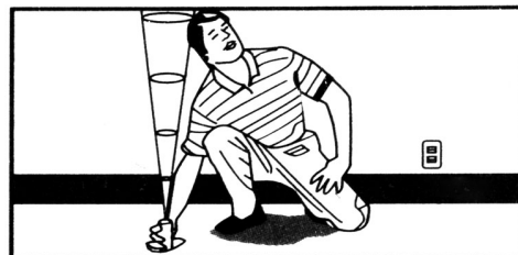
Измерване на височина